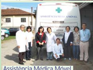
Assistência Médica Móvel