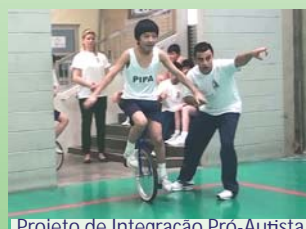
Projeto de Integração Pró-Autista